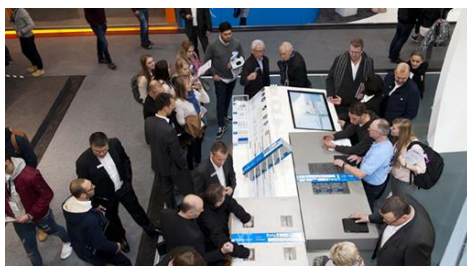
Główną atrakcją tegorocznego stoiska była wyspa prezentująca nowość – Isokorb XT-Combar

Wzrost liczby osób, które odwiedziły stoisko Schöck o około 44 procent w porównaniu do roku 2015 znalazł wyraźne odzwierciedlenie w większej liczbie projektantów i architektów na stoisku. Thomas Lange, odpowiedzialny za region sprzedażowy obejmujący Polskę, Niemcy i Austrię, podsumował prezentację firmy Schöck na BAU 2017 jako pełen sukces: "Nasze